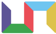
Geef me de 5 de autisme-methodiek Geef me de 5 logo

Ik werk aan de hand van de methodiek Geef me vijf. Geef me de vijf staat voor het begrijpen van autisme en dat het kind zich gezien en begrepen voelt. Vanuit die basis wordt er gekeken naar hoe het kind basisrust op school kan ervaren, problemen opgelost kunnen worden en dat hij of zij zich ontwikkelt. Aan de hand van wat het kind nodig heeft bied ik dit aan door middel van tekenen, gesprekken, spellen en Brain Blocks. Daarnaast kan ik met behulp van Brain Blocks de psycho-educatie autisme aan u als ouders en in de klas geven.